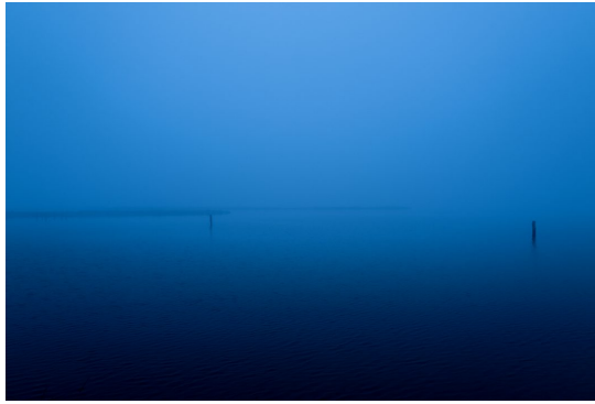
Maxime Alexandre, "TEMPO, Essenziali in solitudine", Palazzo Palumbo Fossati, Venezia

Nella visione fotografica d'insieme, della solitudine e dell'essenzialità degli artisti cui Alexandre si rivolge paragonandoli agli elementi della laguna, nonostante vi sia una chiave di lettura, ogni scatto riesce a trasportare l'osservatore in un luogo silenzioso aperto a qualsiasi riflessione, freddo nella sua tonalità ma nello stesso tempo intimo. Da un punto di vista stilistico egli ha voluto sottolineare il richiamo alla pittura, da sempre utilizzata come riferimento nel suo lavoro cinematografico di Direttore della Fotografia, scegliendo una stampa che ha avvicinato le fotografie ad acquarelli, in cui cielo e acqua si confondono esaltando i singoli elementi raffigurati. Ad accompagnare alcune fotografie, condividendone la riflessione, le voci di artisti e creativi che hanno fatto parte del percorso artistico di Alexandre. Tra loro Marjane Satrapi , regista e pittrice iraniana, autrice del film di animazione "Persepolis" e del film "The Voices" realizzato con la fotografia cinematografica di Alexandre stesso, e Alexandre Aja , regista e produttore francese con cui l'autore ha girato più film, fra cui "The Hills Have Eyes" ed "Oxygène".